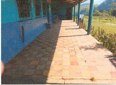
Foto1: SUSTITUCION DE PISO POR DETERIORO